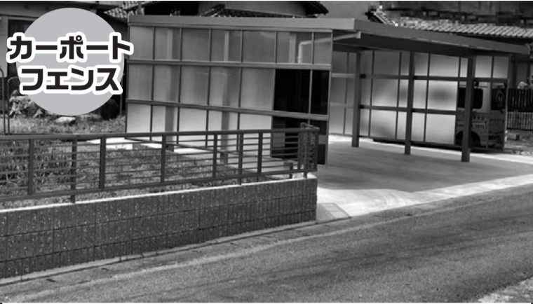
カーポート フェンス

お風呂・キッチン・間取り変更などの室内・水廻り工事だけでなく、外廻り工事もお任せください。事例をもとにご提案いたします!